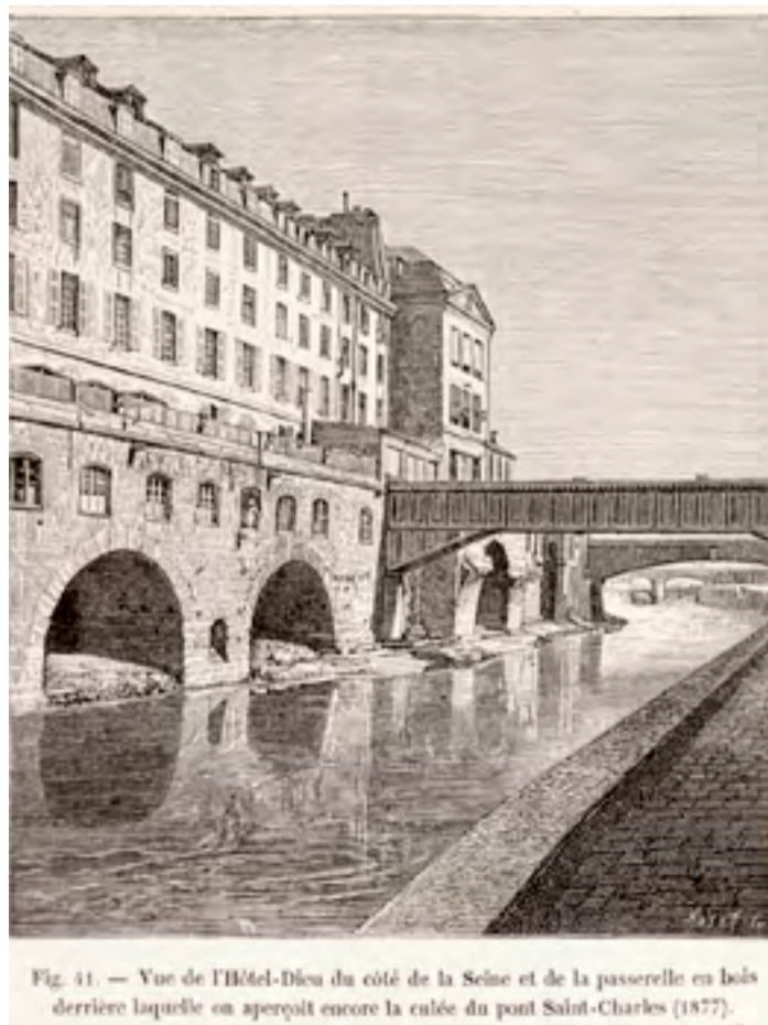
Fig. 41. — Vue de l'Hôtel-Dieu du côté de la Seine et de la passerelle en bois derrière laquelle on aperçoit encore la culée du pont Saint-Charles (1877).

n°13 Sur le trottoir opposé, à gauche du portail bleu (sortie du SAMU), au-dessus de la petite balustrade sur la façade latérale, remarquez le trou dans le mur. Il s'agit des traces d'un tir d'obus échangé lors de la Libération de Paris en août 1944.