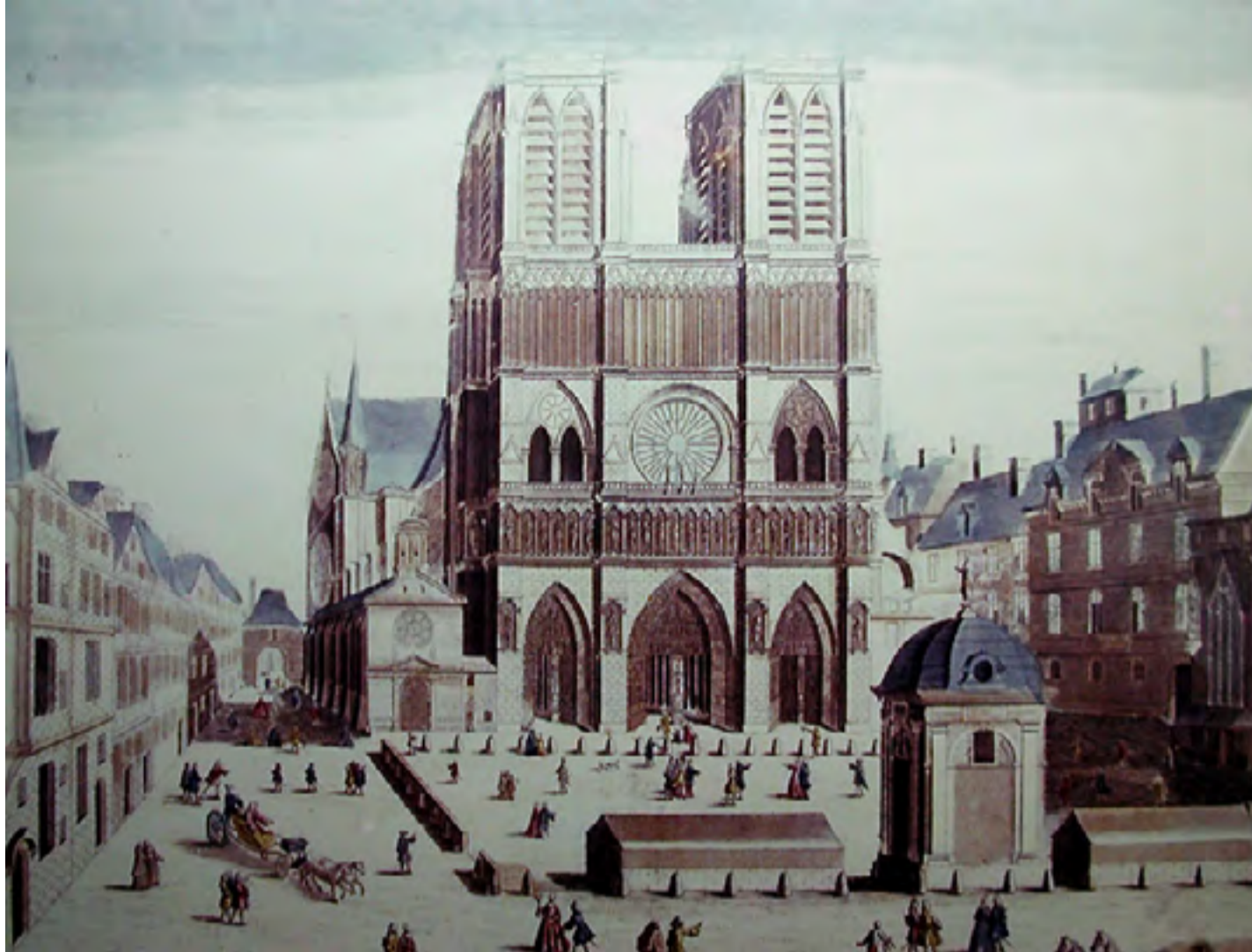
Le parvis de Notre-Dame de Paris avant 1748 Gravure anonyme du XVII e siècle

Sortez du square par la droite et avancez jusqu'au parvis de Notre-Dame.